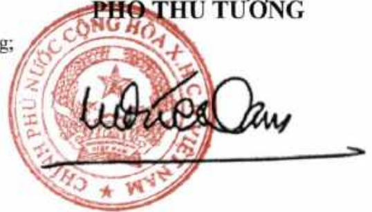
Vũ Đức Đam

TM. CHÍNH PHỦ KT. THỦ TƯỚNG PHÓ THỦ TƯỚNG